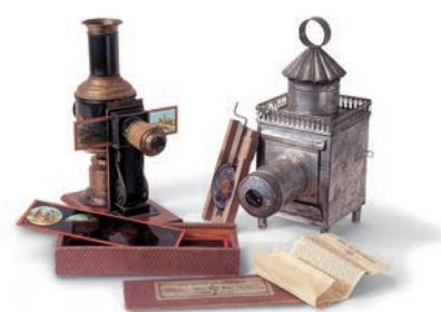
■ um 1890 | Nürnberg, Plank ■ um 1845 | Paris, Lapierre

■ Fondé en 1901 en tant que «Musée industriel et artisanal de la région de Meiningen», le musée allemand du jouet passe pour être la plus ancienne collection spécifiquement consacrée aux jouets dans toute l'Allemagne. Dans la seconde moitié du XIXe siècle, la ville de Sonneberg s'est développée comme un centre international de fabrication et de commerce de jouets. Il était donc logique que le musée, dont nous sommes redevables à l'enseignant Paul Kuntze (1867–1953), soit consacré aux produits de cette industrie.