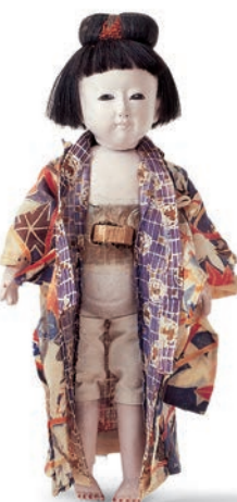
■ 4. Jh. v. Chr. | griechisch ■ 1377–1360 v. Chr. | ägyptisch ■ um 1850 | Japan

■ Einfache gedrechselte und geschnitzte Puppen aus den Alpentälern, aus Böhmen, dem Erzgebirge und dem Sonneberger Gebiet galten über Jahrhunderte als charakteristische Spielpuppen. Im 19. Jahrhundert erlaubte die Verwendung plastischer Massen (Teig, Papiermâché) eine zunehmend feinere Gestaltung. Der Einsatz des Werkstoffs Papiermâché machte die Puppenherstellung zum wichtigsten Zweig der Sonneberger Industrie.