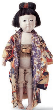
■ 4. Jh. v. Chr. | griechisch ■ 1377–1360 v. Chr. | ägyptisch ■ um 1850 | Japan

■ Einfache gedrechselte und geschnitzte Puppen aus den Alpentälern, aus Böhmen, dem Erzgebirge und dem Sonneberger Gebiet galten über Jahrhunderte als charakteristische Spielpuppen. Im 19. Jahrhundert erlaubte die Verwendung plastischer Massen (Teig, Papiermâché) eine zunehmend feinere Gestaltung. Der Einsatz des Werkstoffs Papiermâché machte die Puppenherstellung zum wichtigsten Zweig der Sonneberger Industrie.