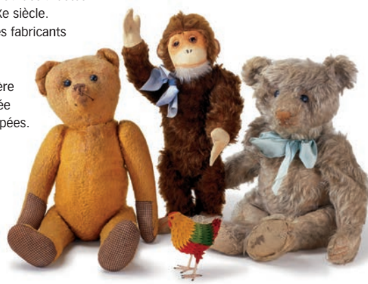
■ 1900–10 | Waltershausen, Kämmer & Reinhardt ■ Lichte, Heubach ■ Sonneberg, Marseille ■ 1912 und 1910 | Käthe Kruse ■ 1900–11 | unbekannt ■ Sonneberg, Leven & Sprenger ■ Glengen/Steiff