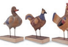
■ 18. Jh. | Sonneberg ■ Ende 18. Jh. | Gröden ■ um 1920 | Sachsen ■ 1914 | Judenbach

■ Seit 1830 gewann Porzellan für die Herstellung von Puppenköpfen Bedeutung. Kugelgelenke, Stimmen und Schlafaugen ließen die Puppen immer menschenähnlicher werden. Sie entstanden meist nach dem Vorbild der bürgerlichen Dame. Einen kindlichen Puppentyp schufen Münchner Künstler am Anfang des 20. Jahrhunderts. Diese Reform regte Fabrikanten zur Herstellung von „Charakterpuppen“ an. Zelluloid fand als erster Kunststoff seit 1896 Eingang in die Puppenherstellung.