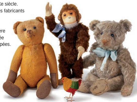
■ 1900–10 | Waltershausen, Kämmer & Reinhardt ■ Lichte, Heubach ■ Sonneberg, Marseille ■ 1912 und 1910 | Käthe Kruse ■ 1900–11 | unbekannt ■ Sonneberg, Leven & Sprenger ■ Glengen/Steiff