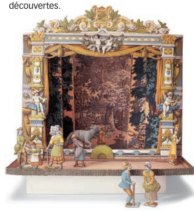
■ um 1900 | Deutschland

■ Savez-vous à quoi ressemblait un jouet, il y a 5.000 ans? Vous êtes-vous déjà émerveillé(e) devant la délicatesse de teint et la tendresse d'expression d'une poupée en biscuit de porcelaine? Avec-vous jamais vu des figurines de «Lilliputiens» en pâte à sel? Le musée allemand du jouet vous fait voir ces pièces originales, et bien d'autres curiosités encore. Si, pour les aînés, sa visite est un retour au temps béni de l'enfance, les enfants eux-mêmes voyageront dans l'histoire du jouet et y feront d'incroyables découvertes.